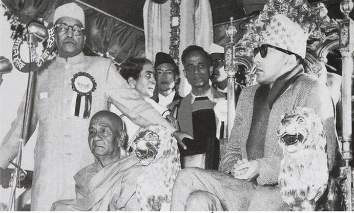
चित्र नं. ३: २० नोभेम्बर १९५६मा काठमाडौंमा तत्कालीन राजा महेन्द्र (सवैभन्दा देब्रेपट्टि)को उपस्थितिमा भाषण दिँदै डा. अम्बेडकर (सवैभन्दा दाहिनेपट्टि)।

सिंहदरवारस्थित स्टेट ग्यालेरी हलमा बौद्धहरूको विश्व फेलोशिपको चौथो सम्मेलनको समापन सत्रमा उल्लेखनीय भाषण दिएका थिए। उक्त कार्यक्रममा राजा महेन्द्र प्रमुख अतिथि थिए। उनलाई अहिले राष्ट्रपति निवासमा परिणत भएको काठमाडौंको महाराजगञ्जस्थित सरकारी अतिथि गृह शितल निवासमा बसेका थिए। बौद्ध सम्मेलनको सफलतामा भिक्कु अमृतानन्द महास्थविरलगायत नेपालका बौद्ध भिक्षुहरूसँगको ठूलो भूमिका थियो। उक्त अन्तर्राष्ट्रिय सम्मेलनलाई सहज बनाउन राज्यले पनि महत्वपूर्ण भूमिका खेलेको थियो। नेपाल बौद्ध धर्मको माध्यमबाट शान्ति कायम गर्न प्रतिबद्ध रहेको विश्वलाई सकारात्मक सन्देश दिँदै सम्मेलन सफलतापूर्वक सम्पन्न भएको थियो। (बज्राचार्य २०६७)