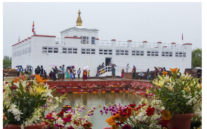
चित्र नं. २: मायादेवी मन्दिर, नेपाल

थेरवादमा हरेक मनुष्यले आफै निर्वाणको मार्ग खोज्नु पर्नेहुन्छ । यस समुदायमा युवाहरूलाई भिक्षु बनाउनु धेरै शुभ मानिन्छ र युवाहरू कोह दिनको लागि भिक्षु बनाई फेरी गृहस्थमा फर्किने चलन पनि छ । थेरवाद दक्षिणी एशियाली क्षेत्रहरू जस्तै श्रीलङ्का, बर्मा, कम्बोडिया, भियतनाम, थाइल्याण्ड र लाओस आदीमा प्रचलित छ (Zaun 2002) । प्राचीन समयमा ‘हीनयान’ लाई ‘थेरवाद’ को शाखा भन्ने गर्दथे, जसको अर्थ महायानको विपरित कमि भन्ने थियो ।