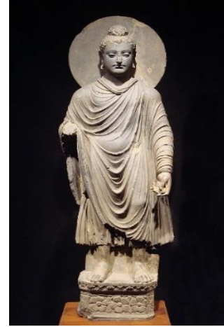
चित्र नं. १: गन्धारमा पहिलो शताब्दी ईसवीमा बनेको गौतम बुद्धको मूर्ति