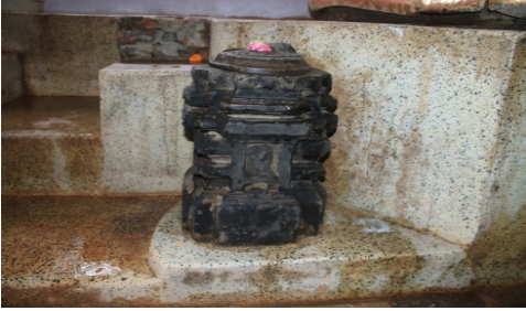
चित्र नं. ४ : शंकराचार्य मन्दिर भित्र रहेको श्रीयन्त्र, पशुपतिक्षेत्र