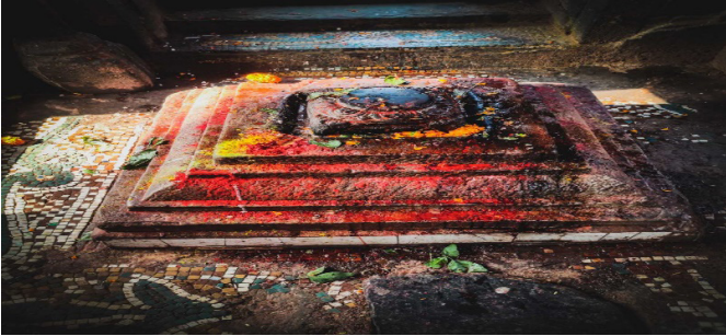
चित्र नं. ५ : यन्त्ररूपी-वत्सलेश्वरी, पशुपतिक्षेत्र