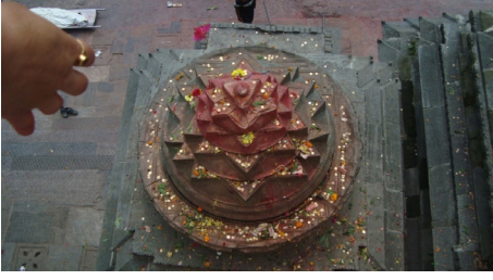
चित्र नं. ३ : गङ्गामाई मन्दिरको गजुर स्वरूप रहेको श्रीयन्त्र, पशुपतिक्षेत्र