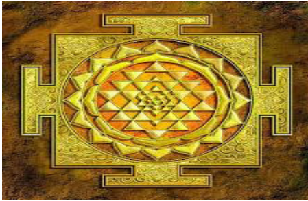
चित्र नं. २ : श्रीयन्त्रको चित्र