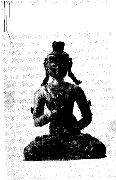
तस्वीर १: अमोघसिद्धि, चौथौ शताब्दीको धातुमूर्ति (राष्ट्रिय सङ्ग्रहालय)