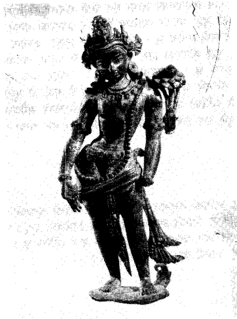
तस्वीर २: पञ्चपाणि लोकेश्वर पन्धौ शताब्दीको धातुमूर्ति (राष्ट्रिय सङ्ग्रहालय)